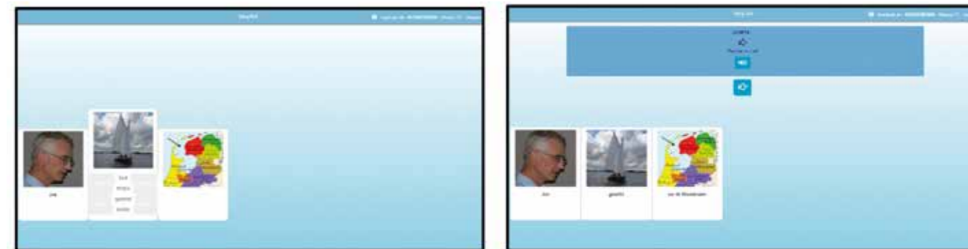
Figuur 2. Links: De juiste werkwoordsvorm wordt gekozen uit zeilt, zeilen, gezeild, zeilde. Op vergelijkbare wijze wordt het juiste voorzetsel gekozen bij het concept de Waddenzee (hier niet afgebeeld). Rechts: Een grammaticaal correcte telegramstijluiting is gevormd (Jos gezeild op de Waddenzee) en wordt door de gebruiker uitgesproken.